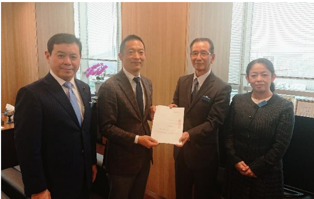
左から 薬丸、長谷部区長、神田代表監査委員、國貞監査委員