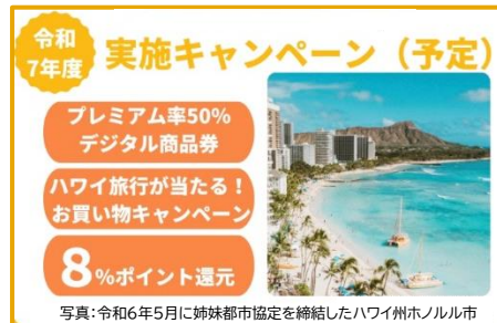
写真:令和6年5月に姉妹都市協定を締結したハワイ州ホノルル市