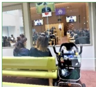
防音の親子傍聴席

議場には車いすスペースや親子傍聴席もあります。傍聴ご希望の方は庁舎13階の区議会フロアにお越しください。ご住所・お名前をご記入いただき、傍聴券をお渡しいたします。