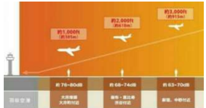
国土交通省 ホームページより

渋谷区の上空900mから600mを飛行して滑走路に進入するもので、本区内において最も高度の低い地域では、航空機の音は68から74デシベルが想定されています。