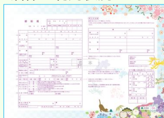
文京区 婚姻届

ジナル届出書についても、今後ニーズ調査や、他自治体の利用状況もヒアリングしながら検討していく。