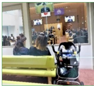
防音の親子傍聴席(ベビーベッド有り)

議場には車いすスペースや親子傍聴席もあります。傍聴ご希望の方は庁舎13階の区議会フロアにお越しください。ご住所・お名前をご記入いただき、傍聴券をお渡しいたします。