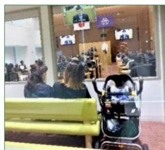
防音の親子傍聴席

議場には車いすスペースや親子傍聴席もあります。傍聴ご希望の方は庁舎13階の区議会フロアにお越しください。ご住所・お名前をご記入いただき、傍聴券をお渡しいたします。