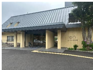
エントランスとラウンジ