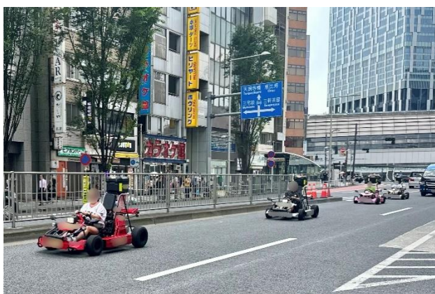
渋谷駅周辺の公道を走行するカート（イメージ）