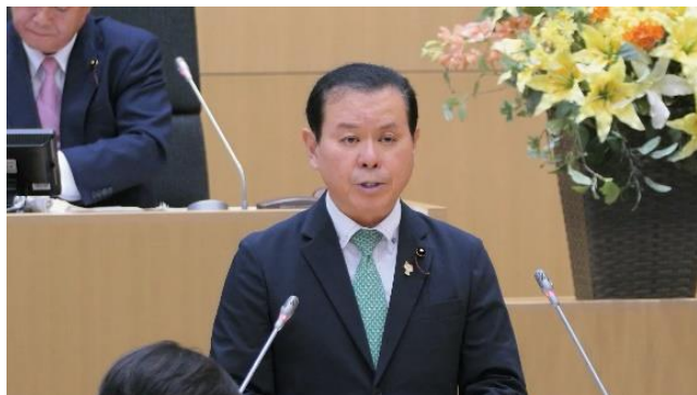
都市環境委員会委員長として 委員会の審査経過と結果を報告