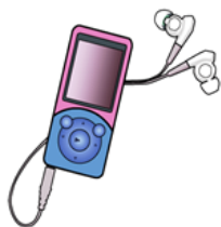
携帯音楽プレーヤー