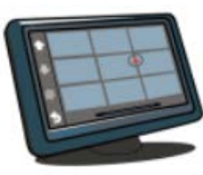
ポータブルカーナビ