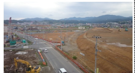
進む土地区画整理

17日は気仙沼市役所で都市基盤整備や土地利用方針の策定について話を伺い、被災地復興の現地視察を行いました。