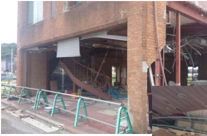
3年経った今でも 当時のままの建物も…