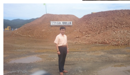
盛り土かさ上げによる住居地の造成 (3.2mの盛り土)