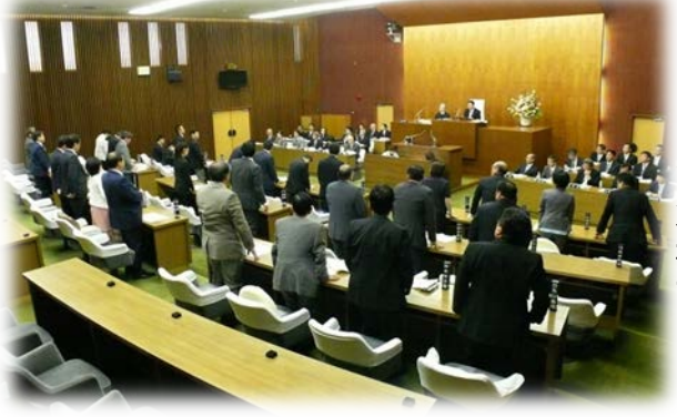
本会議での採決 (賛成者起立)

今定例会では、区長提出による条例案3件、平成25年度補正予算案1件、契約案件4件、人事案件3件、諮問案件1件、報告案件6件等の他、請願・陳情について審議しました。