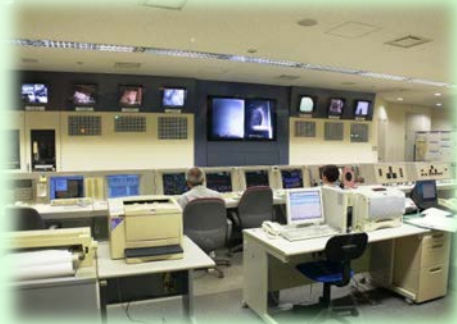
渋谷清掃工場(下は中央制御室)