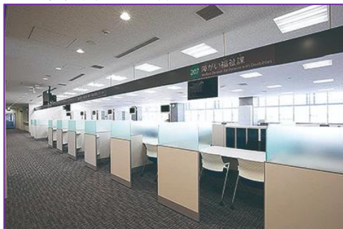
2 F 福祉手続き・相談（イメージ・区HPより）