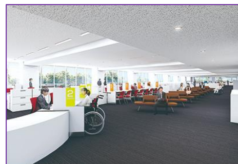
3 F 暮らしの手続き（イメージ・区HPより）