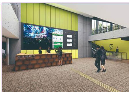
1 F ロビー（イメージ・区HPより）