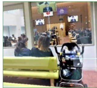
防音の親子傍聴席

議場には車いすスペースや親子傍聴席もあります。傍聴ご希望の方は庁舎13階の区議会フロアにお越しください。ご住所・お名前をご記入いただき、傍聴券をお渡しいたします。