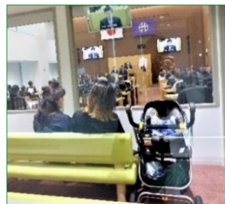
防音の親子傍聴席

議場には車いすスペースや親子傍聴席もあります。傍聴ご希望の方は庁舎13階の区議会フロアにお越しください。ご住所・お名前をご記入いただき、傍聴券をお渡しいたします。