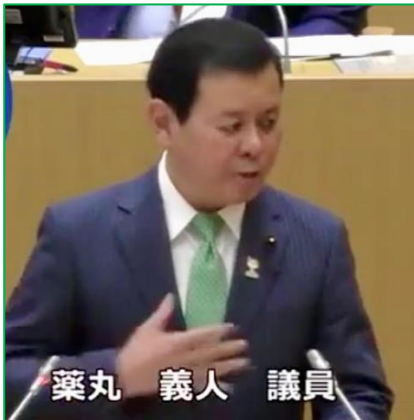
※写真は議会中継のスクリーンショット