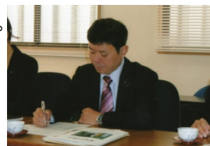
佐賀市役所会議室にて

2日目は対馬空港から福岡空港へ戻り、電車で佐賀市に入りました。佐賀市役所において、幼保小の連続期における教育推進事業や市民総参加子ども育成事業について説明を受けました。幼稚園・保育園から小学校への接続期については、5歳児の12月から小1の5月までの各月ごとの遊びや学習の指導要領を1冊のガイド(170ページ!!)として細かく示しており、市内全園及び小学校で取り入れられていることに驚かされました。視察終了後、電車で長崎へ移動しました。