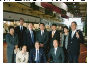
長崎市役所1階総合窓口にて

限られた時間でしたが視察を終え、長崎空港から東京へ戻りました。視察で得たものを区政に反映していきます。