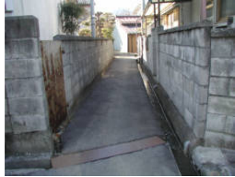
狭あい道路(イメージ)

日現在59件であるが、その後建築確認申請を行うため、実際に工事に着手するのは事前協議開始時期からおよそ45日から60日ぐらにかかる。一方、L字型溝の施工時期は外構工事と同時期に行うことが一般的であるので、後退用地の整備工事を行う時期は、申請から早くても約5ヶ月程度かかるため、現時点では整備工事に至った事例はまだ出ていない。本年11月以降、順次整備されていくものと考える。