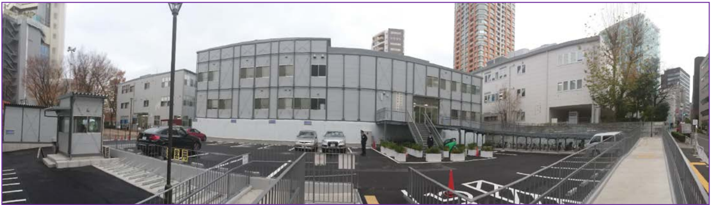
渋谷区役所仮庁舎（右より第1庁舎、第2庁舎、第3庁舎）