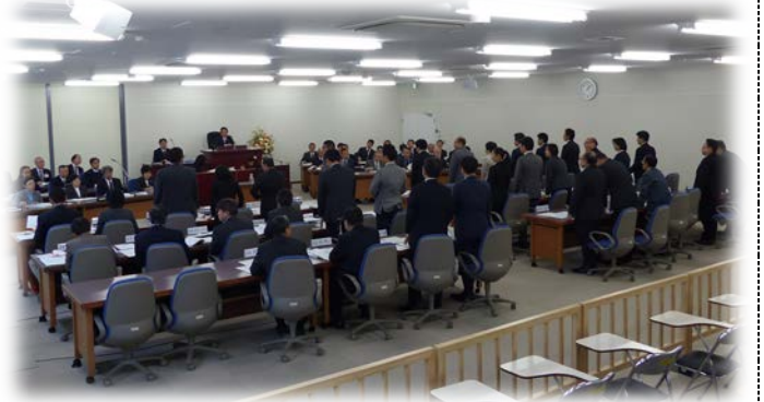
仮庁舎(写真上)と、旧庁舎(写真下)議場での表決(賛成者起立)

渋谷区の議決機関としての役割はこれまでと全く変わりません。今後も区政進展のために全力を尽くします。