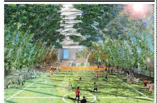
兼運動施設イメージ