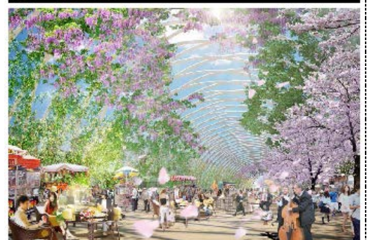
兼多目的広場イメージ