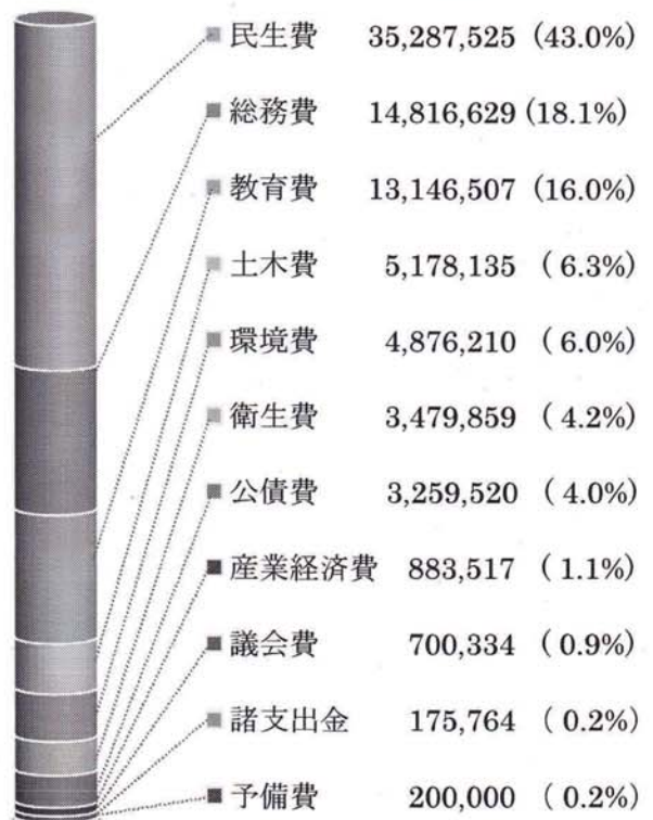
一般会計歳出予算案内訳 (単位:千円)

平成23年度一般会計歳入予算は、長引く不況や「デフレ」の影響のため、歳入の大半を占める 区民税が388億1300万円余 と、22年度の414億8700万円余に比べ 6.4% 、額にして約 26億7400万円の大減 となります。昨年も42億円弱の減収であり、三位一体改革の激変緩和措置による都区財政調整特別交付金30億円も22年度で終了となったことから、 2年間で100億円近い大減収 です。こうした中、本区では子育て支援や高齢者福祉を重点項目として、複数年度を視野に入れた予算配分となっています。一般会計予算案の歳出の項目ごとの額と割合は次の通りです。