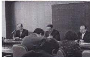
区長(左)による予算案説明

平成23年度当初予算案は、一般会計が前年度当初予算に比べて 3.0%減の820億400万円 。特別会計を含めた 予算総額は、同じく0.3%減の1195億429万2千円 です。