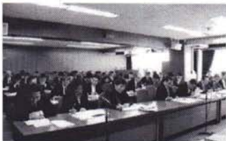
全員協議会 (後方は部課長級職員)

この予算案は3月1日からの渋谷区議会第1回定例会において、約1ヶ月かけて審査をします。